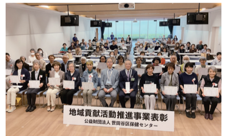
地域貢献活動推進表彰の様子