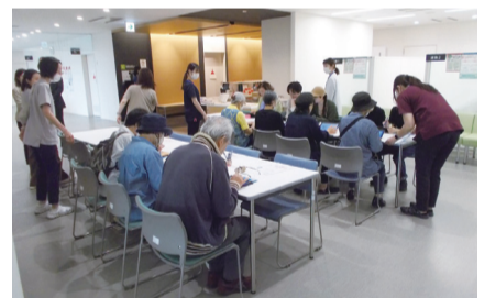
92人が体験した脳の健康チェック

10月18日に開催した2025うめとびあフェスタでは、体験型をテーマに各種測定のほか地域貢献活動推進表彰を行いました。玉川総合支所からゴールのうめとびあまで、6.4kmのウォーキングを行う「健康クイズウォークラリー」に36人が参加。会場の2階・3階では、体成分分析測定や食事バランスチェック、電動車いす試乗ツアー、CT検査装置の見学や乳がん医療用模型で触診体験などを行いました。また、脳の健康度を測定できる「ブレインパフォーマンスのセルフチェック」の体験には、92人が参加しました。保健センターを知って、これから活用してもらおうきっかけとなったイベントでした。