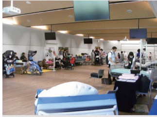
多様な福祉用具が並びます