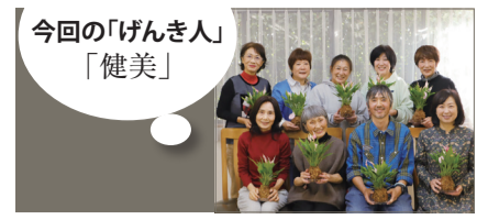
今回の「げんき人」 「健美」

東玉川町会会館(東玉川神社境内)で、第2・4月曜日の午前10時～11時30分に活動。名前の通りに健やかに美しく、60代を中心としたメンバー8人ほどで体操やメンバー企画の活動を行っています。 問い合わせ 03-6265-7513