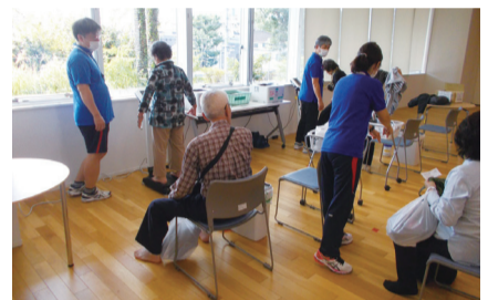
体成分分析測定を行う参加者

10月18日に開催した2025うめとびあフェスタでは、体験型をテーマに各種測定のほか地域貢献活動推進表彰を行いました。玉川総合支所からゴールのうめとびあまで、6.4kmのウォーキングを行う「健康クイズウォークラリー」に36人が参加。会場の2階・3階では、体成分分析測定や食事バランスチェック、電動車いす試乗ツアー、CT検査装置の見学や乳がん医療用模型で触診体験などを行いました。また、脳の健康度を測定できる「ブレインパフォーマンスのセルフチェック」の体験には、92人が参加しました。保健センターを知って、これから活用してもらおうきっかけとなったイベントでした。