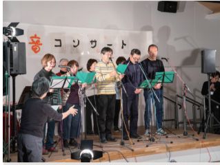
春の音色が会場に響きわたります