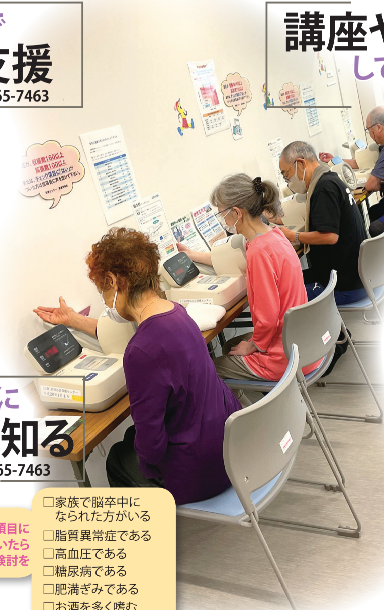
運動教室参加前に血圧測定をする様子