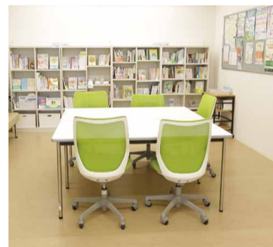
ここからからだの保健室ポルタ (保健センター2階)

①三茶おしごとカフェ 6/24(土)、10/28(土) 午前9時～正午 ②保健センター 8/26(土)、1/27(土) 午前9時～正午 ■予約専用電話 ☎6265-7536