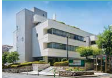
(公財)世田谷区保健センターは区立保健センターと区立総合福祉センターを運営しています。